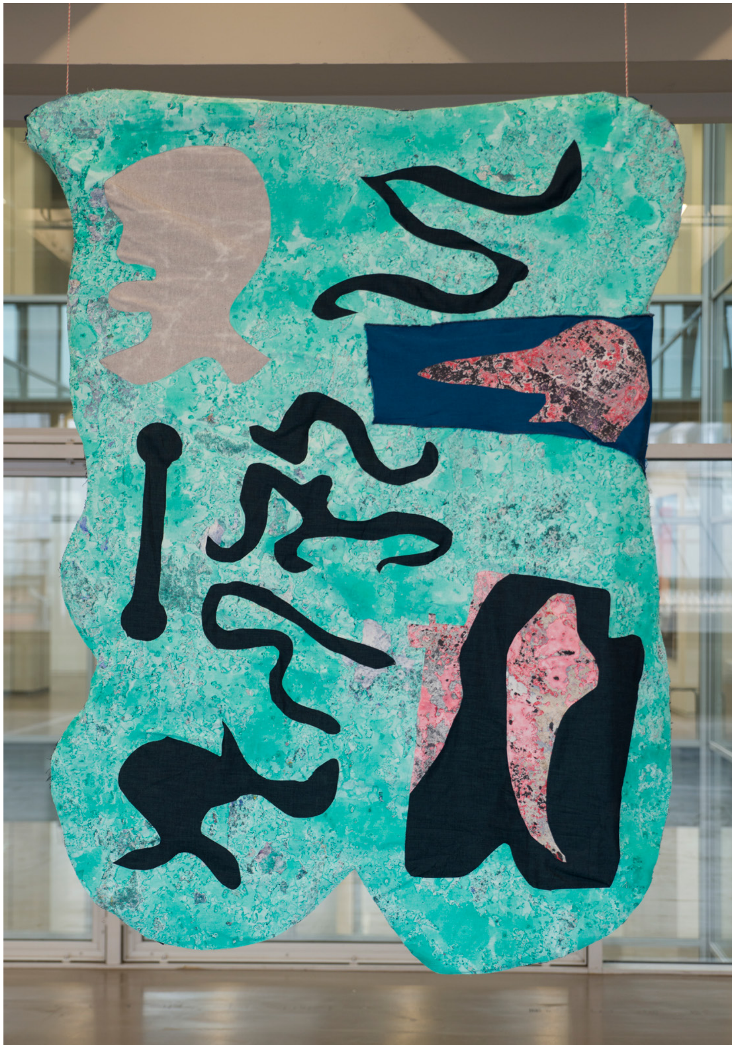
Nosfra, toile acrylique cousu sur textiles