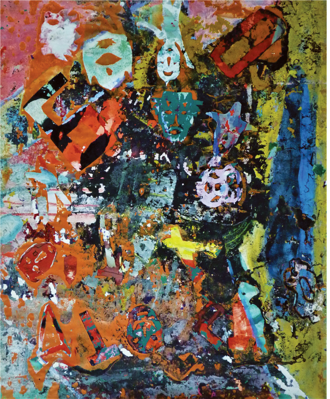
Sans titre , huile, acrylique et pastel gras sur toile : 140 x 90 cm