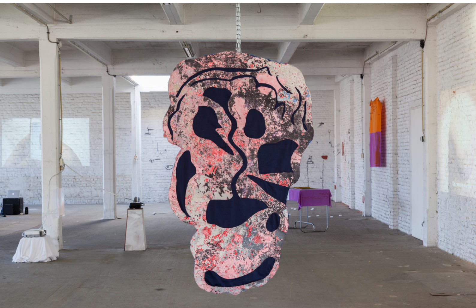
Vue d'exposition Les Temps Sauvages , toile acrylique cousu sur jeans