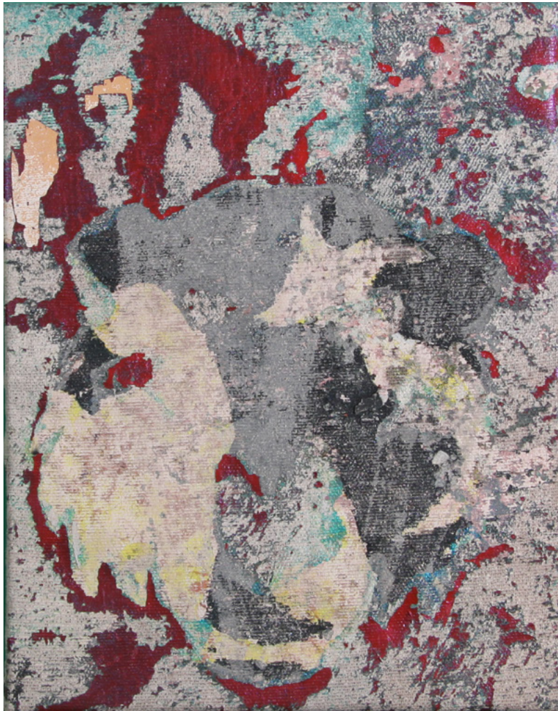
Sans titre , acrylique sur toile : 40 x 25 cm