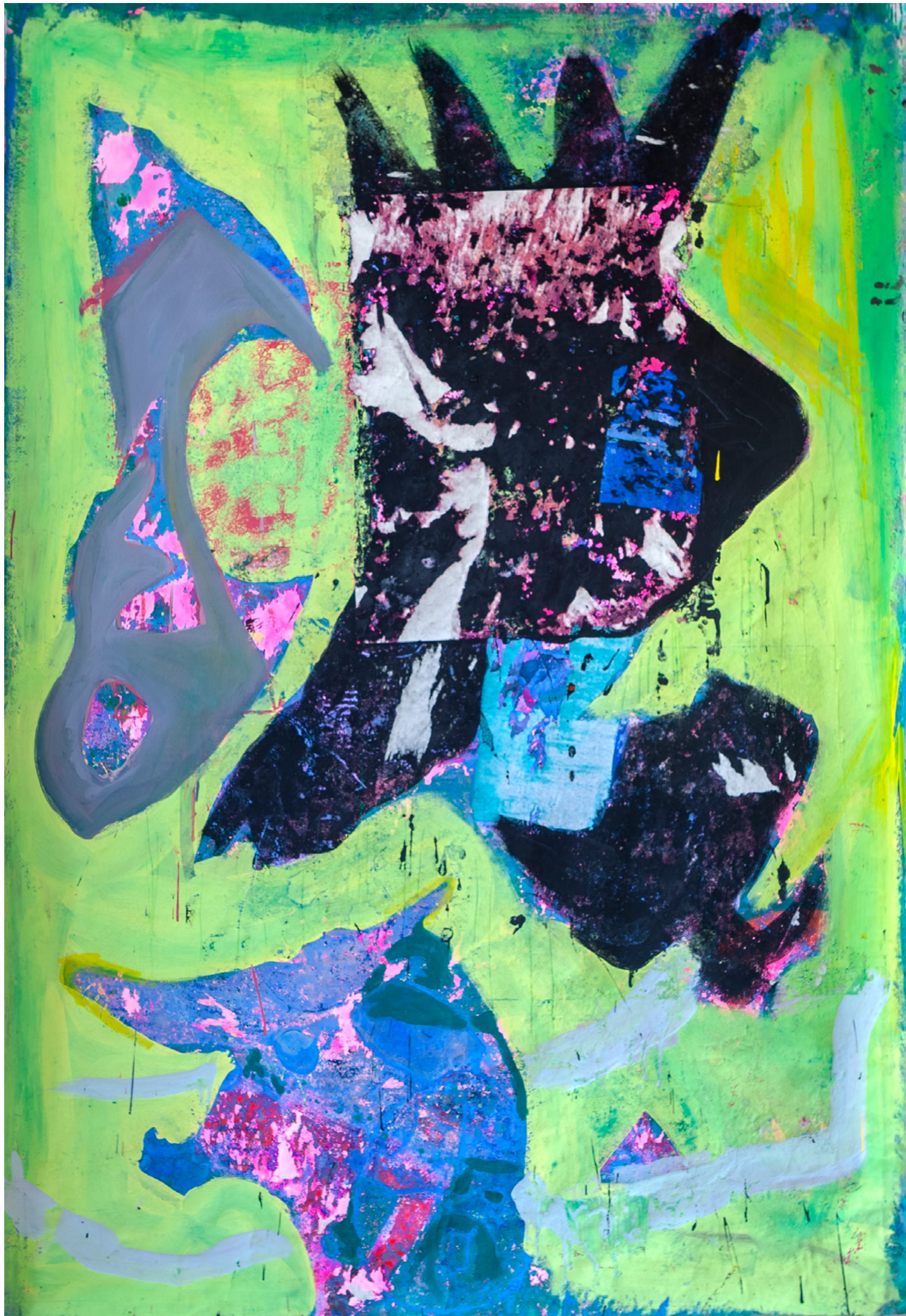
Sans titre, acrylique sur toile : 180 x140 cm