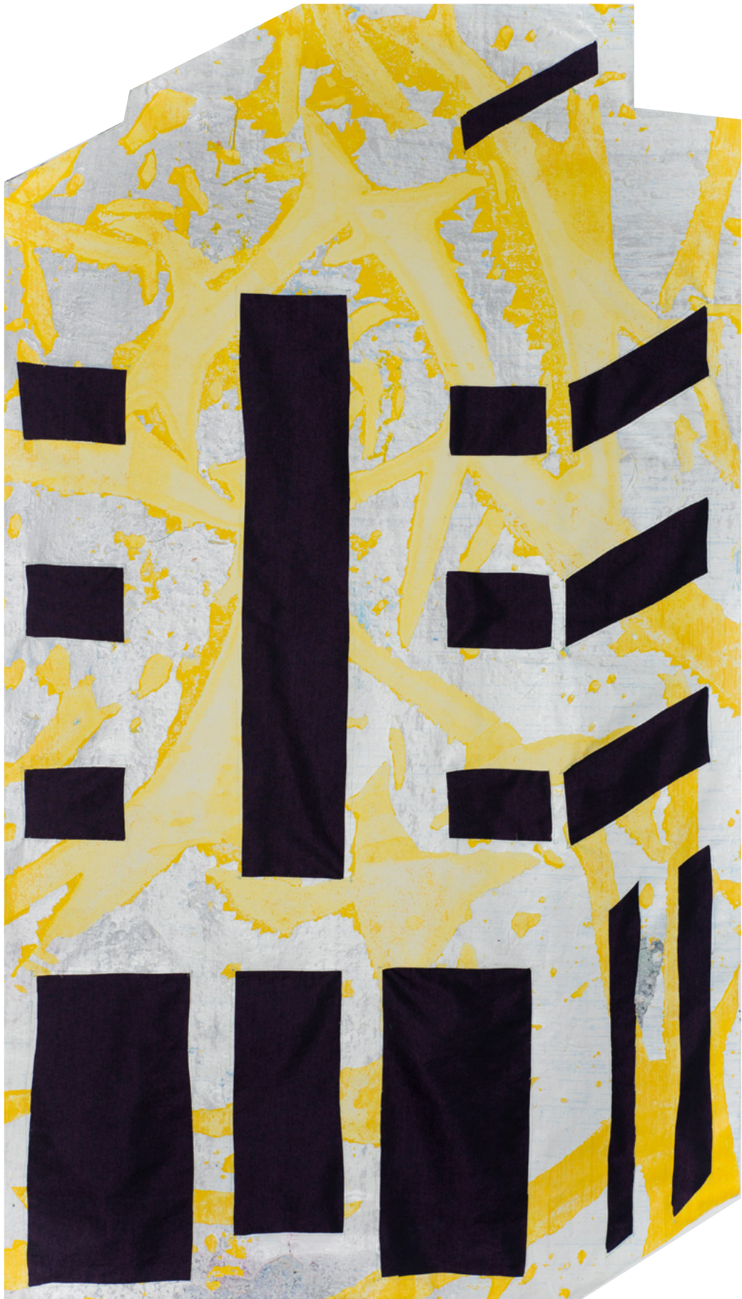
Bâtiment , toile acrylique cousu sur jeans : 175x120 cm