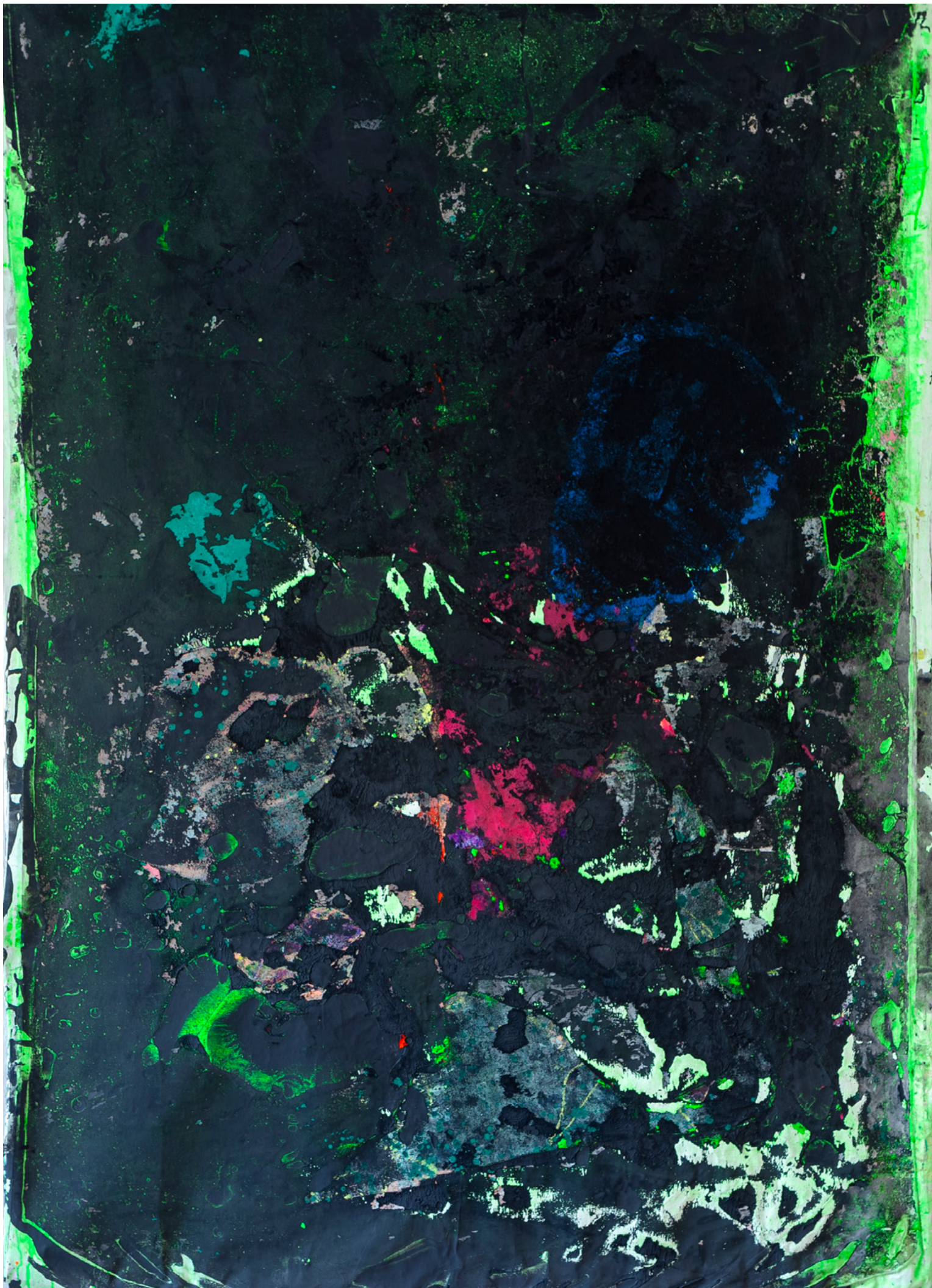
Le Prince de la nuit , acrylique et pigments sur toile : 170 x 140 cm