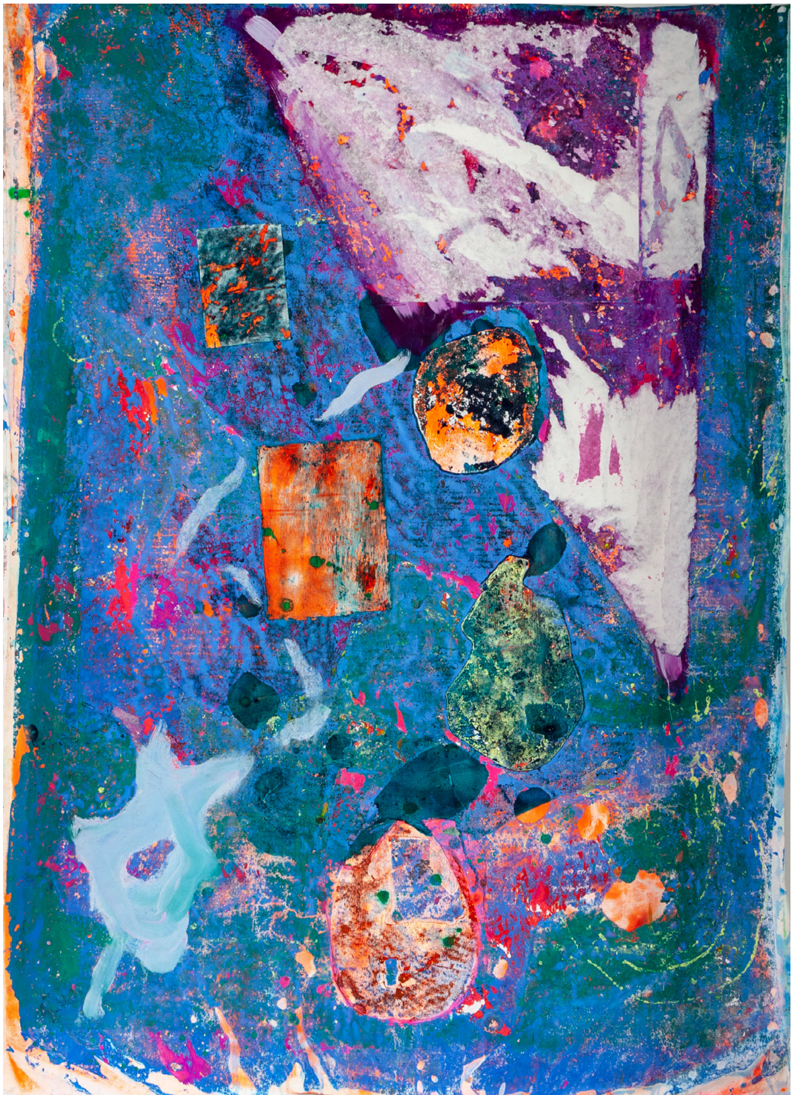
Sans titre , papier, acrylique et pigments sur toile : 190 x 140 cm